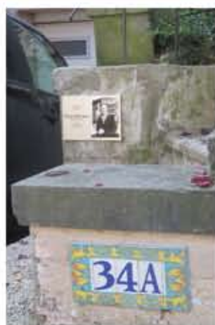
Plaque commémorative «Paul Delvaux» au 34A Avenue des Campanules Herinneringsplaat «Paul Delvaux» Klokjeslaan 34A.

Kunstenaar Paul Delvaux (Antheit 23/9/1897- Veurne 20/7/1994) woonde in Watermaal-Bosvoorde van 1950 tot 1984. Nadien zal hij het einde van zijn leven in St Idesbald en Veurne doorbrengen.